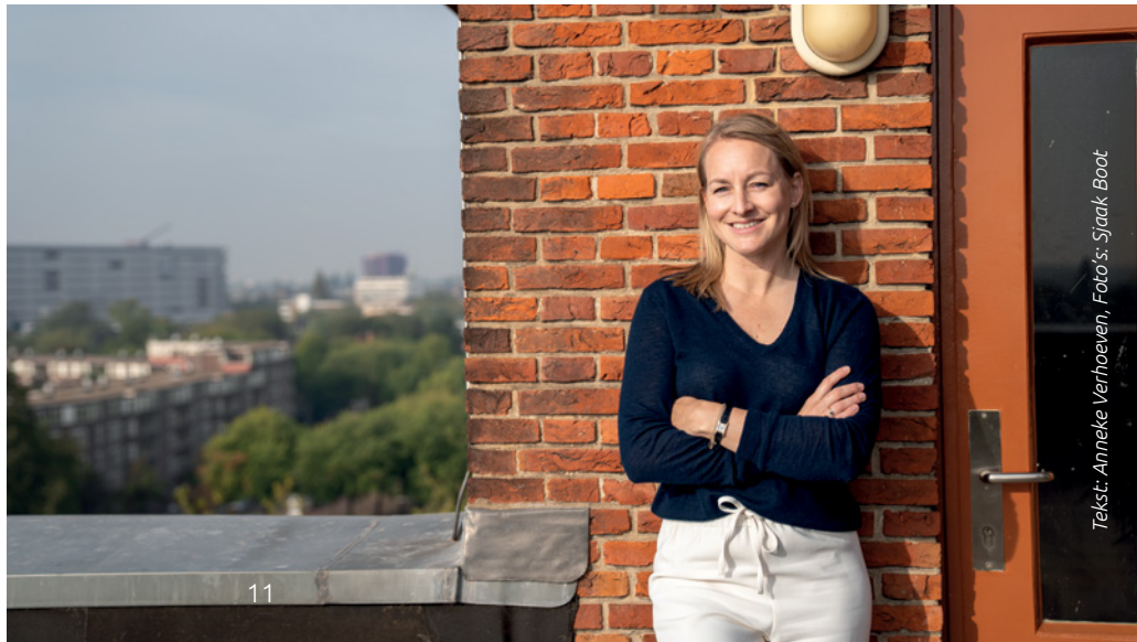
Tekst: Anneke Verhoeven